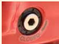
Mando Manual emergencia