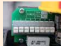
4 Finales Carrera