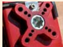
Multi ISO 5211